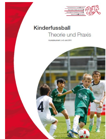
Abbildung 2: Broschüre Kinderfussball [1]

https://www.football.ch/SFV/Breitenfussball/Service/Bestellungen/bestellungen.aspx